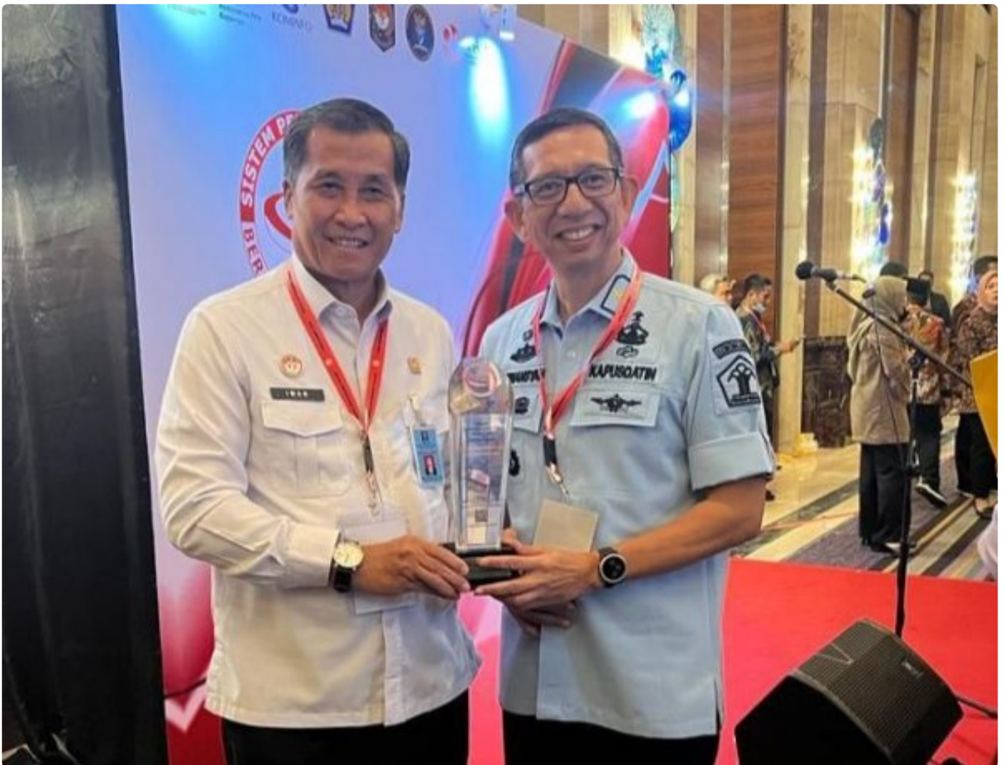
Kemenkumham Terima Award Kategori SPBE Terbaik Tahun 2021 - 2022

JAKARTA - Kementerian Hukum dan HAM (Kemenkumham) menerima